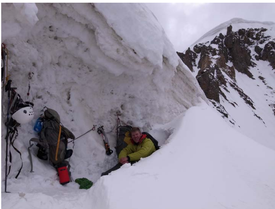
Bivuak på Peak Alexandre