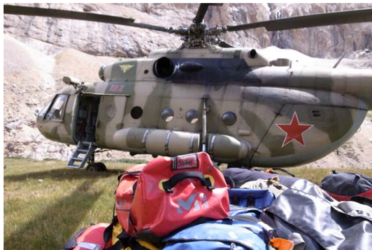
Helikopteren der transporterede os til basecampen.