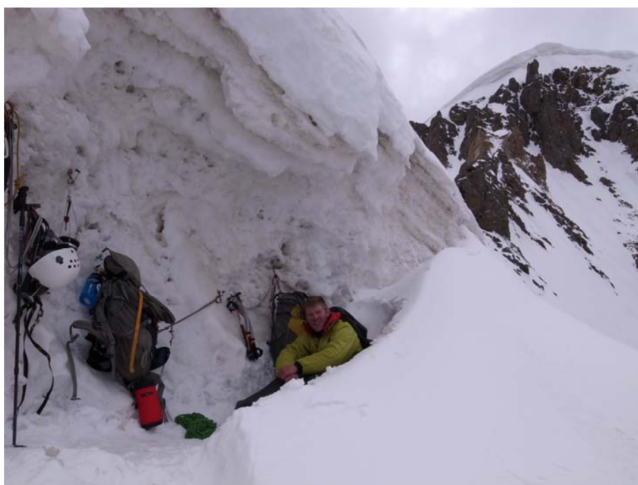
Bivuak på Peak Alexandre