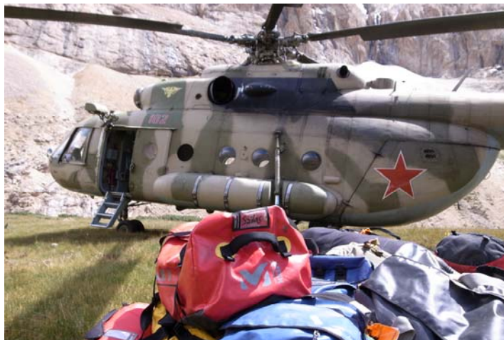
Helikopteren der transporterede os til basecampen.